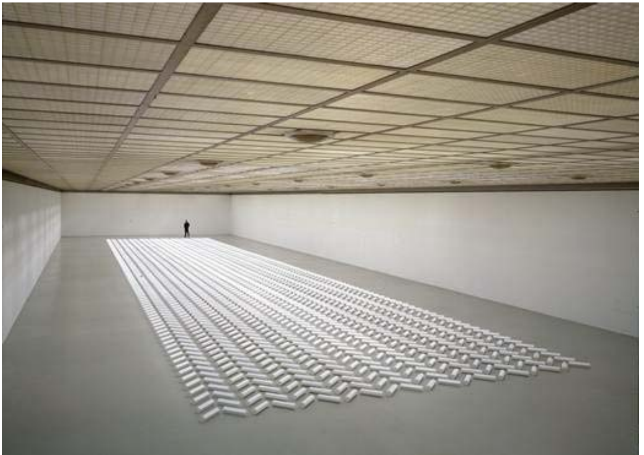
Walter de Maria