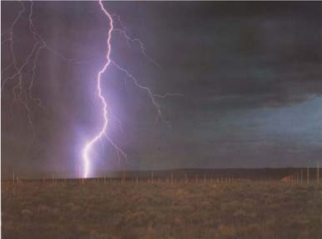
Walter de Maria, Lightning Field, Utah, USA, 1973-1977