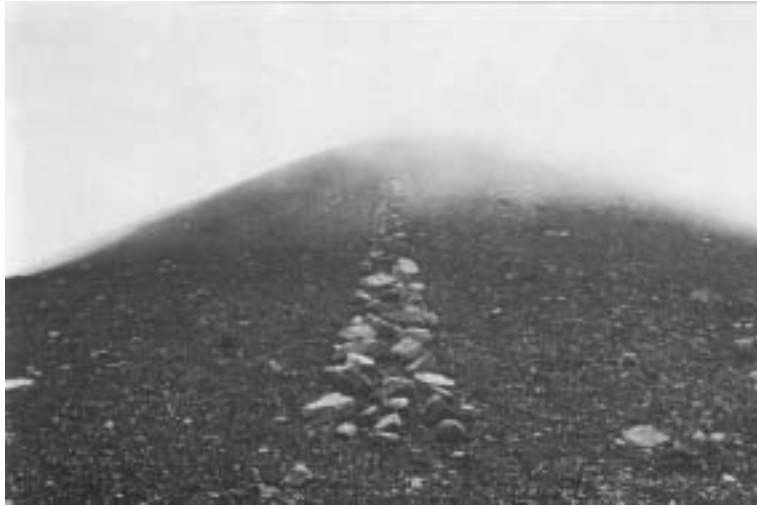
Richard Long, A Line in Japan, 1979,