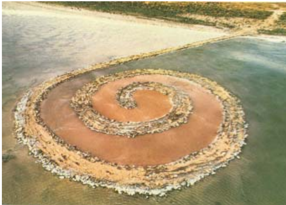
Robert Smithson, Spiral Jetty, Utah, USA, 1970