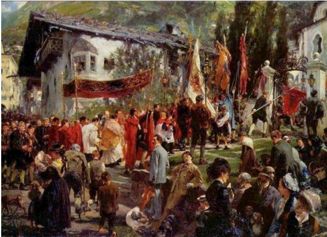
Adolf Friedrich Erdmann von Menzel: Fronleichnamsprozession in Hofgastein, 1880, Öl auf Leinwand, 51,3 × 70,2 cm, München, Neue Pinakothek.