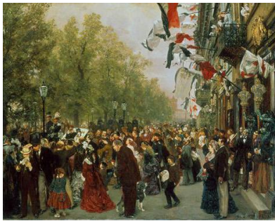
Adolph Menzel, Abreise des König Wilhelm zur Arme , 1870, Nationalgalerie Berlin

Eine Leseempfehlung für Kunstlehrer und eine Leseprobe.