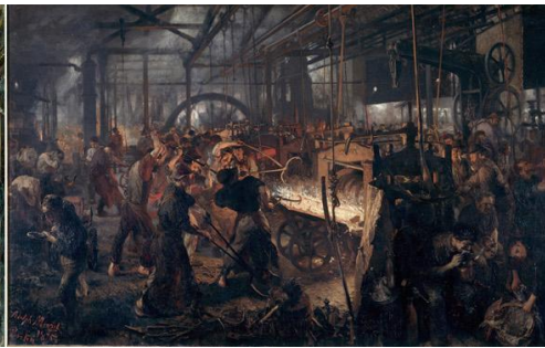
Adolph Menzel, Das Eisenwältwerk , 1875, Nationalgalerie Berlin